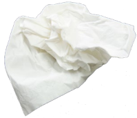
Mouchoir en papier